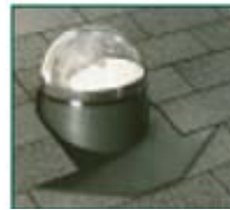
Domo tubular ODL de 10" de diámetro

*Basado en iluminación a medio día con un tubo de 48" de largo