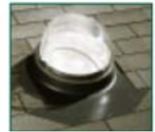
Domo tubular ODL de 10" de diámetro